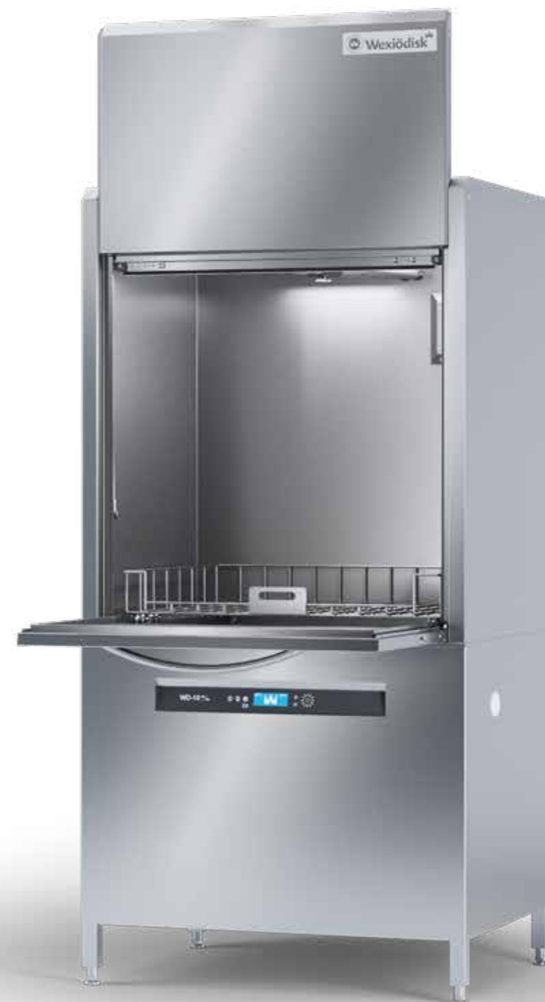
WD-10S är designad för att diska skrymmande gods och har därför en öppningshöjd för diskgoods på hela 820 mm. För installationer där exempelvis takhöjden är lägre, finns en version med en öppningshöjd på 690 mm.

TILLVERKAD AV CIRKULÄRT ÅTERBRUKAT ROSTFRITT STÅL för att minska koldioxidutsläpp