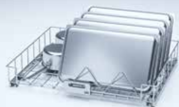
GROVDISK HÅLLARE LÅG för bakplåtar och kantiner mm.

Den rostfria korgen med måtten 670 x 815 mm ingår i leveransen. Ett urval av tillbehör finns tillgängliga för att effektivt hantera olika typer av diskgoods.