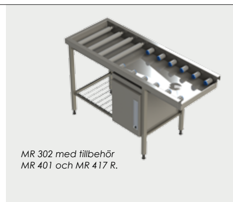
MR 302 med tillbehör MR 401 och MR 417 R.